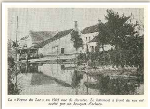
La « Ferme du Lac » en 1905 vue de derrière. Le bâtiment à front de rue est coché par un bouquet d'arbres.