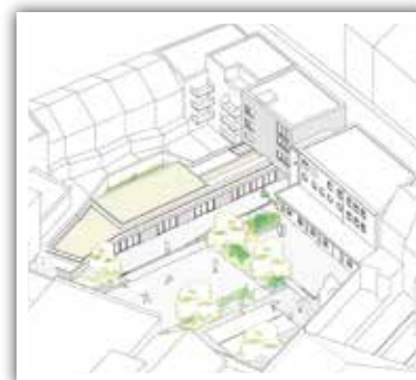
Nouvelle maison de Quartier (Marconi) Nieuw buurthuis (Marconi)

Deze operaties bevinden zich in het stadium van de stedenbouwkundige vergunning en zullen tussen april en juni onderworpen worden aan een openbaar onderzoek. Het gaat om de bouw van een voorzieningencomplex (wijkrestaurant, foyer, auditorium en zalen voor het beoefenen van zachte sporten), de herinrichting van de "dalle" (Albertzone), de renovatie en de uitbreiding van het kinderdagverblijf "Les Bout'chics" (Besme), de herindelings van het kinderdagverblijf "La Ruche" (Vanden Corput) en, ten slotte, de bouw van een nieuw Buurthuis en de heraanleg van de buitenruimten (Marconi). Tegelijkertijd start het team de procedures op voor de aanstelling van de aannemers. Begin van de werken in 2017!