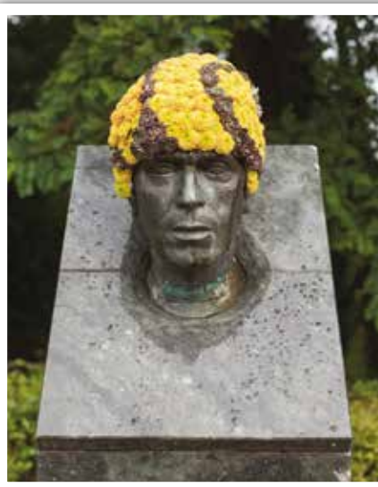
Stedelijke ingreep van de Vorstse kunstenaar Geoffroy Mottart