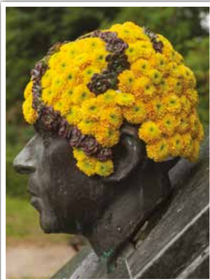
Intervention urbaine de l'artiste forestois Geoffroy Mottart